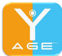
Y-Age glutazione e carnosina

Per avere il migliore risultato da questo protocollo vanno utilizzati sostanzialmente due tipi di cerotti: