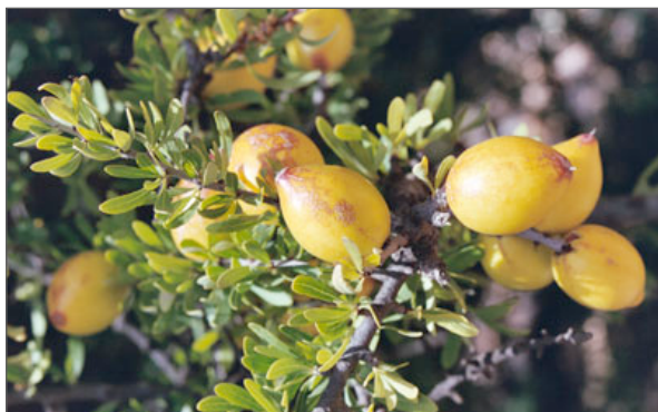
Frutti d'albero di Argan

Prunus Amygdalus Dulcis Oil, Cera Alba, Argania Spinosa Oil, Elaeis Guineensis Oil, Butyrospermum Parkii Butter, Aphanizomenon Flos Aquae Powder, Cupressus Sempervirens Oil, Achillea Millefolium Oil.