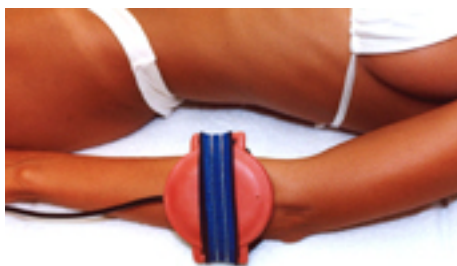
Fig.7: epicondilite / gomito del tennista