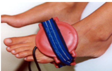
Fig.21: metatarsalgia / fratture del piede