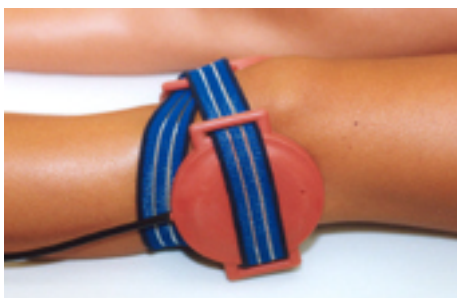
Fig.17: distorsioni / traumi al ginocchio