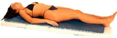
Fig.9: tutto il corpo