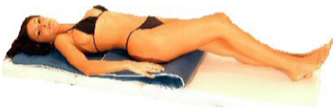
Fig.11: schiena-bacino doppio