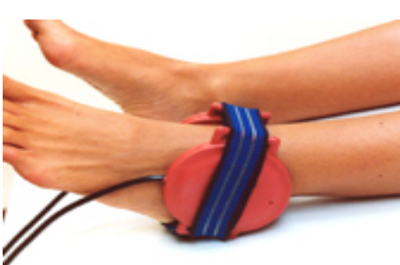
Fig.20: distorsioni / fratture alla caviglia