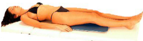
Fig.7: ginocchia / gambe