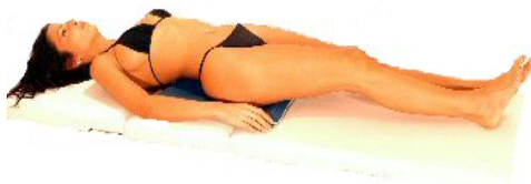
Fig.6: dorso / schiena / bacino