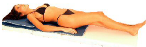
Fig.10: capo-spalle doppio