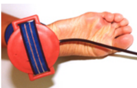
Fig.22: tallonite / fratture del tallone