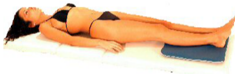
Fig.8: caviglie / piedi