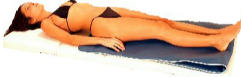
Fig.12: caviglie-piedi doppio