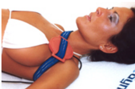
Fig.3: dolori articolazione spalla-clavicola