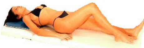
Fig.5: testa / collo / spalle