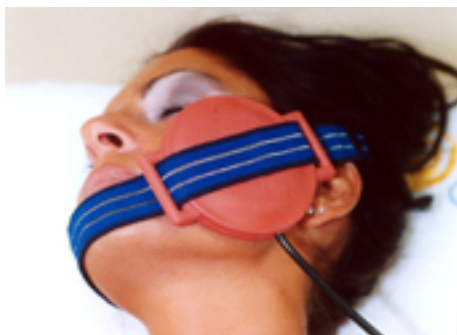
Fig.1: mal di denti / nevralgia al trigemino