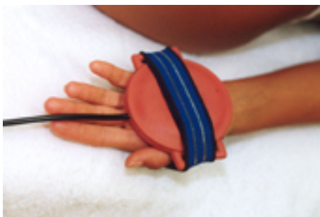
Fig.9: formicolio / mani fredde - calde