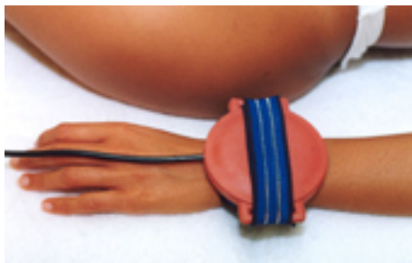
Fig.8: dolori al polso / artrosi