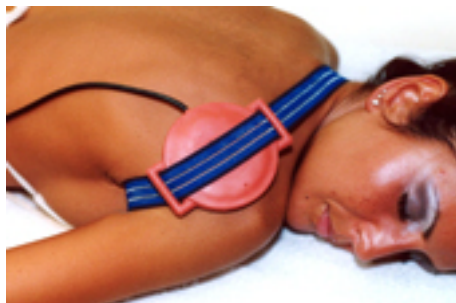
Fig.4: periartrite / dolori di spalla