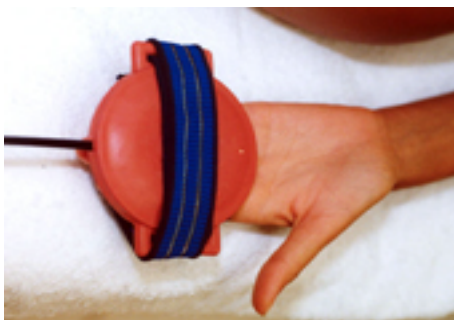
Fig.10: artrosi alle dita / fratture