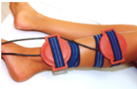
Fig.19: fratture della gamba / periostite